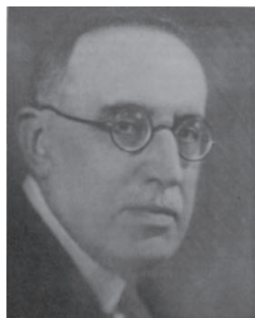
Fig. 2 - Vittorio Novarese.

Nato a Torino nel 1861, Novarese fu uno dei più illustri ingegneri e geologi del Regio Ufficio Geologico, autore di estesi rilevamenti per la Carta Geologica del Regno, vere pietre miliari delle conoscenze del nostro territorio nazionale (Argentieri & Pantaloni 2013).