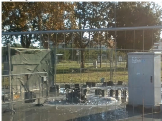
Fig. 1 - Fumarola in località Coccia di Morto (Fiumicino, Roma).

Una confortante riscontro lo ha recentemente fornito un caso concreto, verificatosi a fine Agosto 2013 nell'area deltizia del Tevere. A seguito di una perforazione geognostica effettuata in località Coccia di Morto (Fiumicino, Roma), all'interno di una rotatoria contigua l'Aeroporto internazionale "Leonardo da Vinci", si è generata una fumarola, con cospicue e persistenti emissioni di gas (prevalentemente CO 2 ), acqua e fango (Fig. 1).