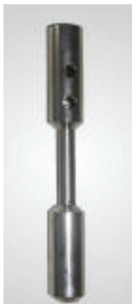
Fig. 1 - Punta sensore di fondo foro per freatimetri.

Relativamente alle misure in foro e al classico freatimetro, la cui tecnologia di base ha resistito nel tempo, si segnala la possibilità che alcuni nuovi prodotti permettono di equipaggiare le sonde con rilevatori di diverso tipo, come termometri e conduttimetri, senza aumentare il diametro della sonda, permettendo quindi di effettuare dei log verticali chimico-fisici, altrimenti effettuabili con ingombranti sonde multi-parametriche. Inoltre alcuni freatimetri di ultima generazione possono anche essere equipaggiati con sensori di fondo foro (Fig.1).