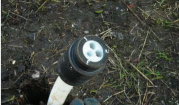
Fig. 3 - Tubo piezometrico multiplo per campionamenti a diverse profondità (CMT – Coninous Multichannel Tubing).

statico, l'infissione di aste cave dotate di un filtro apribile alla profondità desiderata attraverso cui, quindi, poter effettuare dei campionamenti mirati senza dover eseguire perforazioni (Dietrich e Leven 2006). Tramite la stessa tecnica è inoltre possibile parametrizzare gli acquiferi attraverso dei log di resistività (Vienken et al. 2014)