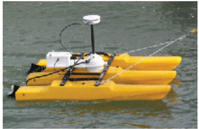
Fig. 5 - Natante per la misura della portata dei corsi d'acqua.

di misura della portata dei corsi d'acqua sono destinate ad essere superate da nuove tecnologie emergenti. Sono infatti già in uso in via sperimentale le fibre ottiche per determinare con precisione tratti di alveo drenanti o disperdenti sempre per mezzo della tecnologia DTS ( Distributed Temperature Sensing ) che si basa sulla misura della modificazione del campo di temperatura generato (Lane et al. 2008; Selker et al. 2006).