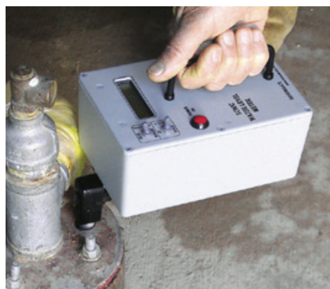
Fig. 2 - Misuratore di livello freatimetrico ad impulsi sonori "Sonic water table meter".

tazione di questo tipo era piuttosto ingombrante e pesante, oggi si fanno strada le fibre ottiche e la tecnologia DTS ( Distributed Temperature Sensing ), tecniche leggere, meno ingombranti e in grado di fornire una risoluzione maggiore (Culshaw 2005; Selker 2008; Tyler et al. 2008). Uno strumento che ritengo però davvero innovativo e che facilita e snellisce drasticamente i tempi di rilevamento piezometrico è il cosiddetto "sonic water table meter" (Fig.2) ossia un misuratore di livello piezometrico ad impulsi sonori. Questo strumento permette, tramite l'emissione di impulsi sonori, di determinare con ottima approssimazione la profondità del livello di falda senza dover calare alcuna sonda all'interno del foro, evitando quindi, soprattutto nei pozzi attrezzati di rischiare che il terminale del freatimetro si vada ad incastrare con la pompa, con i cavi ad essa connessa o con eventuali centratori. La misura è molto rapida e con un buon grado di approssimazione ( \pm 0,2\% ), purché si conosca il range di profondità da indagare (normal 0-60 m o deep 40-350 m) mentre per la misura occorre semplicemente che esista almeno un piccolo foro attraverso cui far passare gli impulsi sonori.