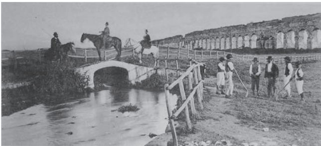
Fig. 3 – 1866 - Veduta dell'Acqua Mariana al IV Miglio con butteri, sullo sfondo dell'Acquedotto Claudio (De Alvaris 2009).

organismo che ebbe la natura giuridica di un Consorzio composto da tutti quelli che usufruivano delle acque per le loro attività commerciali od agricole, come i Gualdatori (ovverosia gli addetti alle valche). Le Valche furono istituite per la lavorazione dei panni di lana. Nell'industria tessile e conciaria la "gualcheria" è l'attrezzatura essenziale per la produzione, battitura e lavorazione della fibra e l'energia necessaria si ricava dalla ruota del mulino ad acqua. Nel 1820, il cardinale Pacca per delega del pontefice riassunse tutti i provvedimenti e assoggettò a servitù di scolo tutte le sorgenti scaturenti nei territori di Marino, Grottaferrata e Tuscolano. Non furono ammesse alterazioni del percorso, fu fatto divieto di modificare le sponde, di alzare ponti, portare animali a bere (Fig.3), improvvisare colture ai suoi bordi.