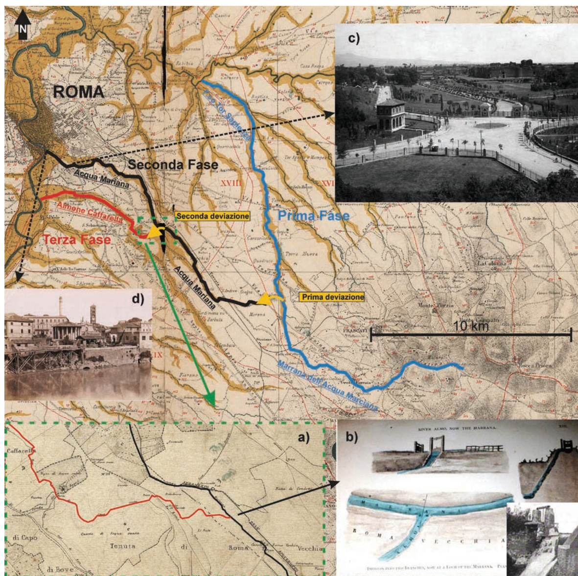
Fig. 1 - Stralcio della "Carta Idrografica del Bacino del Tevere" del 1880 (autore anonimo 1880), alla scala 1:259.200 e schema comparativo dei tracciati degli alvei che nei secoli hanno ricevuto la denominazione di Fosso dell'Acqua Mariana; (a) particolare dell'ubicazione su base cartografica di Troiani (1839) dell'impianto idraulico (b) per la derivazione della Marrana dell'Acqua Mariana a Roma Vecchia, con immagini di dettaglio delle opere (Gaeta 2011); (c) particolare della Passeggiata archeologica di Roma, nel 1914, fotografata dal Palatino, con il Fosso dell'Acqua Mariana subito prima di entrare in collettore per terminare successivamente nella Cloaca Maxima e quindi al Tevere (d - foto del 1905 da Maltese 2012).

territorio romano, dentro e fuori Città e confluenti nei Fiumi Tevere ed Aniene. In questa breve nota si vuole riassumere il contributo di molti Autori sulle vicende relative alla "Marrana dell'Acqua Mariana" che sino agli inizi del XX° secolo scorreva ancora al margine e all'interno delle mura aureliane da Porta San Giovanni a Porta Metronia, per poi sfociare nel Tevere poco a valle della Cloaca Massima (Fig.1).