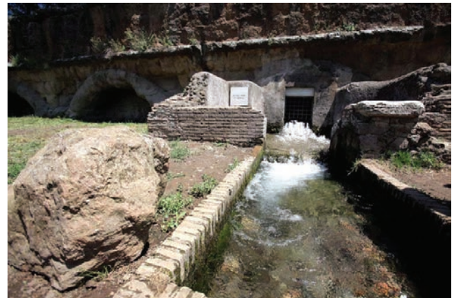
Fig. 4 – Inaugurazione del Laghetto e del Fosso dell'Acqua Mariana presso il Parco Regionale dell'Appia Antica (Parco Regionale dell'Appia Antica 2011).

Alla fine di questa analisi storica viene spontanea una riflessione: ove le acque fluenti cessano di avere un interesse come fonte di energia, come risorsa irrigua o per l'abbeveramento, perché non mantenere il valore ambientale che esse possono offrire attraverso l'ecosistema ripariale (Fig.5) ed il paesaggio