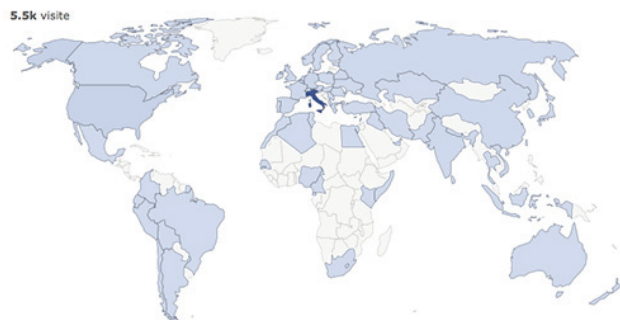
Fig.2 - In blu sono riportati i paesi che hanno visitato la rivista. L'intensità del colore è proporzionale al numero di visualizzazioni - Countries from where the Journal has been visited. Blue intensity shows proportionally the number of visits.