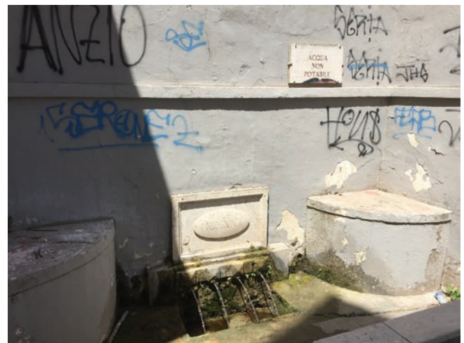
Fig. 5 - Attuale aspetto della Fonte dello Speziale con dicitura di non potabilità dell'acqua.