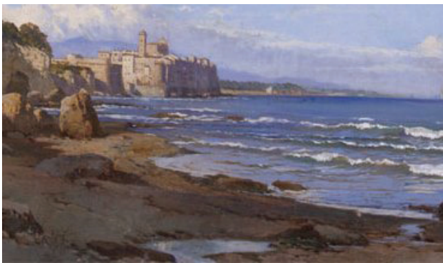
Fig. 4 - Stralcio di Dipinto di Hermann David Salomon Corrodi (sec. XIX) con in primo piano un piccolo corso d'acqua probabilmente corrispondente all'emergenza dello Speziale.

Fig. 3 - Stralcio di rappresentazione del borgo di Nettuno in cui si nota la presenza di una "Fonte" tra Nettuno e Anzio che potrebbe corrispondere alla fonte dello Speziale (dipinto di Antonio Lafreri, inizi del secolo XVI).