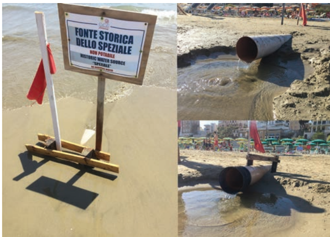
Fig. 2 - I dreni sulla spiaggia di Levante ad Anzio.

Fig. 1 - Location of the study area and of the springs and a simple hydrogeological conceptual model regarding the source of eastern beach.