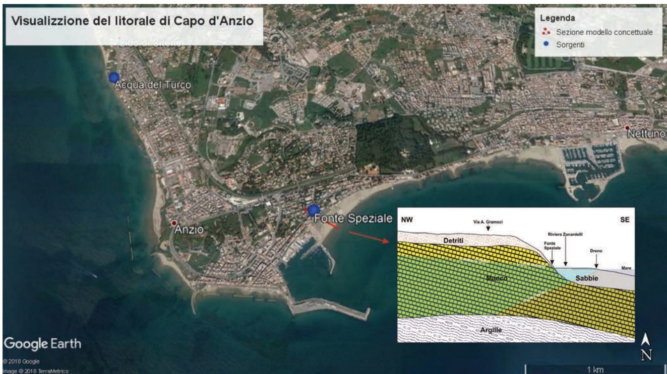
Fig. 1 - Ubicazione dell'area e delle sorgenti con semplice modello idrogeologico concettuale dell'emergenza sulla riviera di Levante.

Fig. 1 - Location of the study area and of the springs and a simple hydrogeological conceptual model regarding the source of eastern beach.