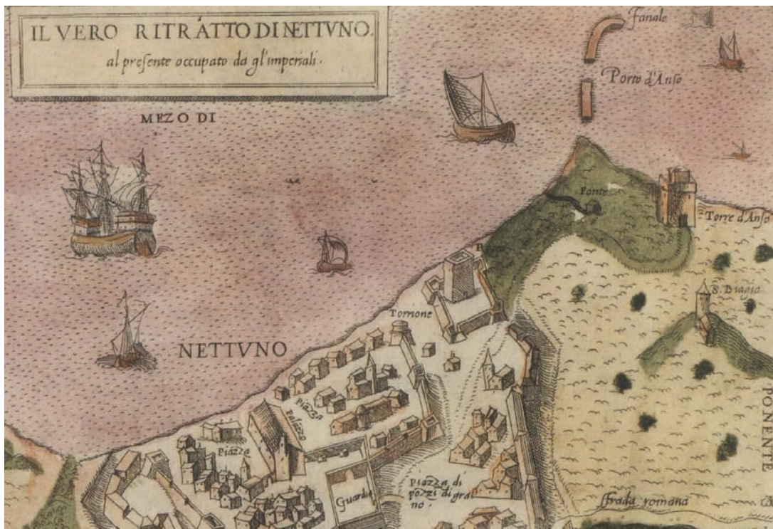
Fig. 3 - Excerpt of representation of a painting showing the town of Nettuno, where it is possible to see a spring (Fonte) between Nettuno and Anzio, which could correspond to the Speziale Spring. (by Antonio Lafreri, early XVI century).

Fig. 3 - Stralcio di rappresentazione del borgo di Nettuno in cui si nota la presenza di una "Fonte" tra Nettuno e Anzio che potrebbe corrispondere alla fonte dello Speziale (dipinto di Antonio Lafreri, inizi del secolo XVI).