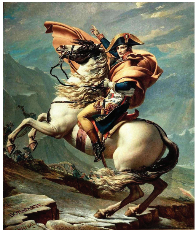
Fig. 2 - Jacques-Louis David (1748-1825) "Napoleone Bonaparte al passaggio del Gran San Bernardo" (1801, olio su tela, Rueil-Malmaison (Paris), Musée National du Château de Malmaison).