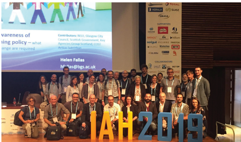
Fig.3 - La delegazione italiana al 46° Congresso IAH.

Il terzo giorno del Congresso è stato dedicato ai field trips, che avevano come oggetto l'illustrazione di casi di studio stimolanti dal punto di vista scientifico e naturalistico (Karst, wetlands e aree costiere) su realtà idrogeologiche spagnole di grande interesse, alcune delle quali di tipo inconsueto essendo relative a contesti climatici semiaridi e non mediterranei come ci si potrebbe aspettare. Di particolare interesse il field