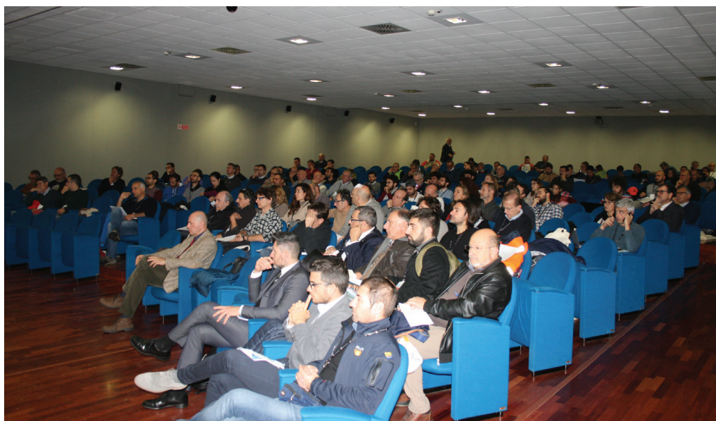
Fig.1 - Alcuni istanti delle lezioni tenute in sala (foto di Patrizia Ronchi).

Analizziamo qui i punti principali riguardanti la perforazione dei pozzi per acqua e geotermia