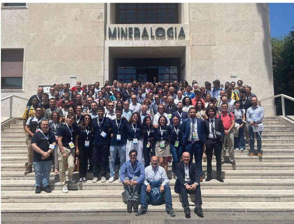
Fig. 1 - Foto di gruppo dei partecipanti ad Eurokarst 2024.

Questo elevato interesse si è confermato con la presenza a Roma di 209 partecipanti (Fig.1), provenienti da 30 paesi, sia europei (19) che extraeuropei (ben 11). Al successo del convegno, che ha battuto il record dei partecipanti delle precedenti edizioni, ha fortemente contribuito la comunità