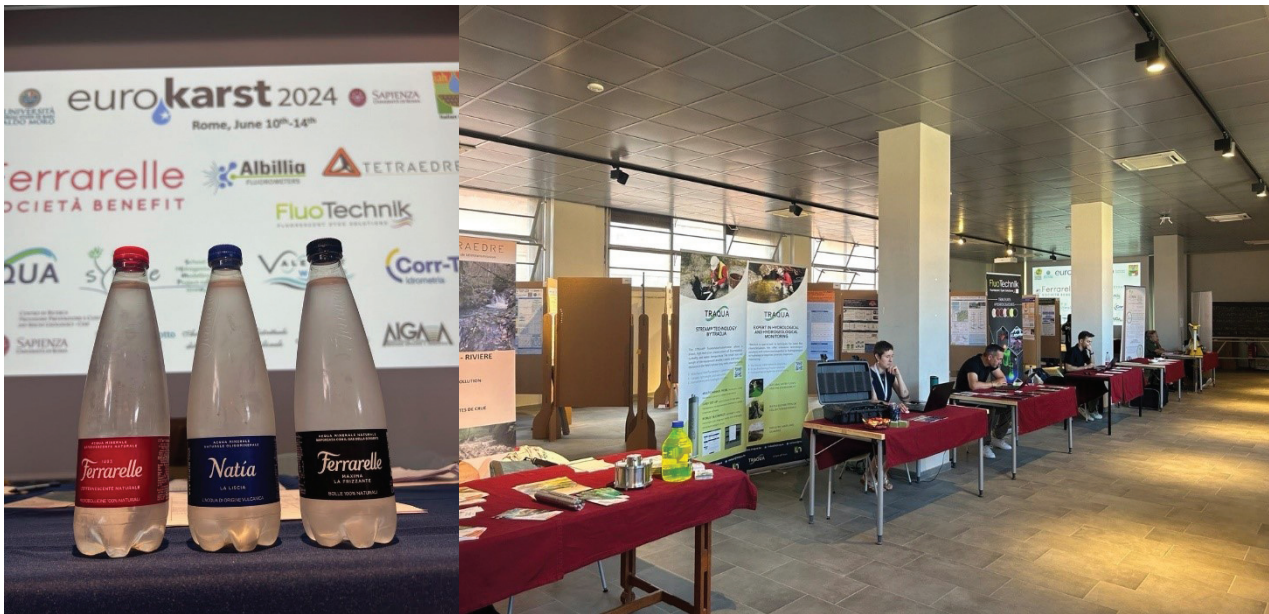
Fig. 3 - L'area espositiva degli sponsor a Eurokarst 2024.

Chiudiamo con la speranza e l'obiettivo di poter ospitare in Italia nei prossimi anni una futura edizione di Eurokarst, visto il successo, sia organizzativo, che scientifico, dell'evento, ad ulteriore dimostrazione del ruolo di spicco raggiunto dall'idrogeologia italiana in ambito internazionale.