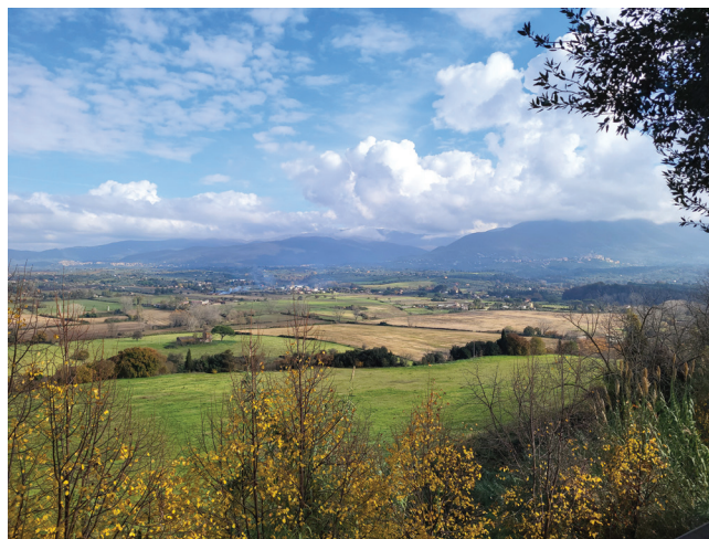
Fig. 5 - Veduta del bacino di Cretone dal belvedere della omonima frazione del Comune di Palombara Sabina, che allo stato attuale delle conoscenze appare il sito con maggiore ricorrenza di eventi nel territorio metropolitano di Roma Capitale.

Le caratteristiche percepite sono state quelle di boato istantaneo, avvertito solo in un perimetro molto circoscritto. In nessuno dei casi menzionati sono stati rilevati effetti al suolo, né danni a edifici o manufatti; l'unico evento registrato dalla rete sismica nazionale gestita dall'Istituto Nazionale di Geofisica e Vulcanologia è stato quello di Capena dell'ottobre 2020.