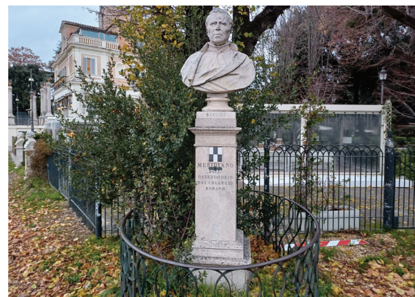
Fig. 1 - Busto di padre Angelo Secchi (1818-1878) presso il Pincio, Roma.

Da questi passi prese avvio un cammino che per varie decadi avrebbe visto geofisica e meteorologia svilupparsi congiuntamente. Nel 1876 fu istituito a Roma l' Ufficio